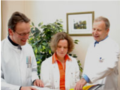
Ärzte des Magen-Darm-Zentrum