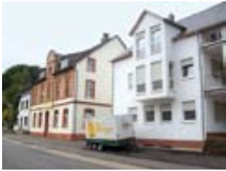
Außenansicht des GPBZ Hermeskeil

1998 wurde in Hermeskeil das erste Gemeindepsychiatrische Betreuungszentrum in Trägerschaft der Barmherzigen Brüder eröffnet. Was zu diesem Zeitpunkt noch als Modellprojekt galt, ist heute, zehn Jahre später, eine verlässliche Anlaufstelle für alle hilfesuchenden Menschen der Region geworden.