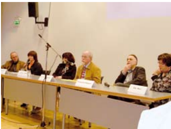
Referenten der Podiumsdiskussion.