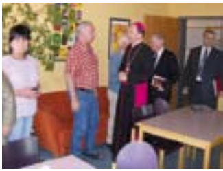
Besuch der Klienten in der Tagesstätte.