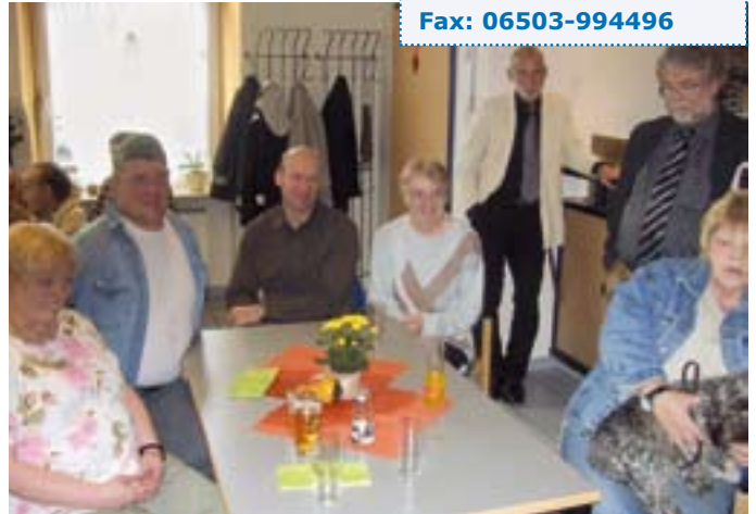
Treffen in der Tagesstätte.