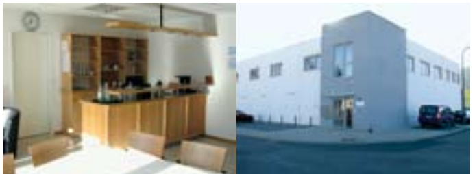
GPBZ Schweich – Aussenansicht und Innenansicht – Tagesstätte