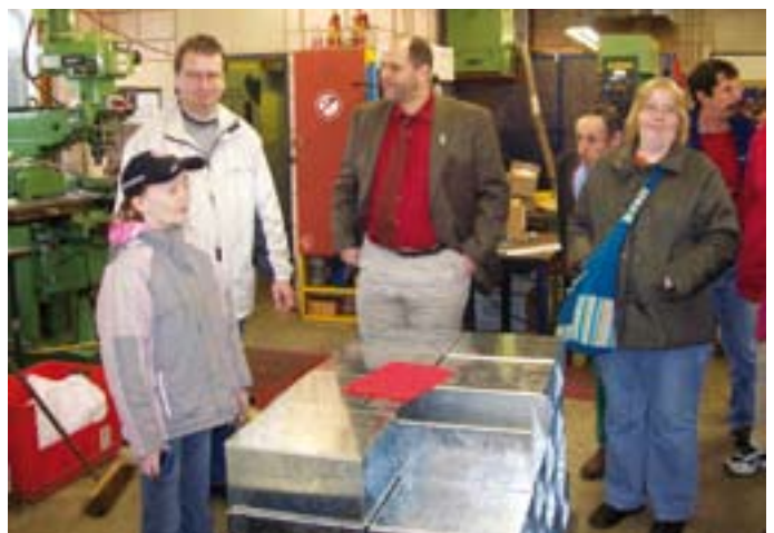
Besichtigung des Metallbereichs.