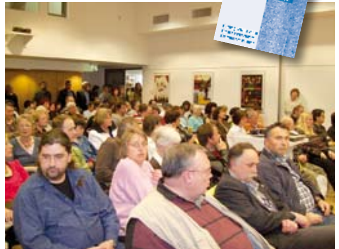
Der Tag der seelischen Gesundheit mit dem Thema „Psychisch krank – nicht für immer. Genesung ist möglich ...“ interessierte viele Menschen in Trier.