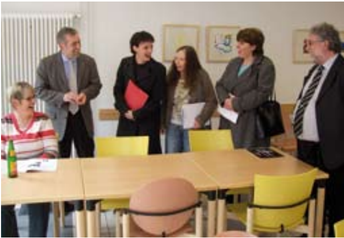
Beim Rundgang auf dem Schönfelderhof: Hier im offenen Treff.