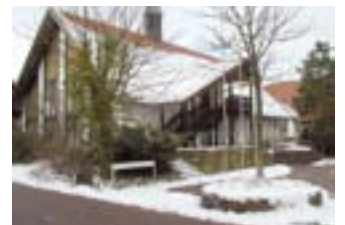
Die Peter Friedhofen-Halle zur Weihnachtszeit.

Weihnachten lädt dazu ein, uns auf den „herunter gekommenen Gott“ auf das Kind in der Krippe einzulassen. Uns ist der Heiland geboren, der allein unser Leben trotz aller Krisen und Bedrohungen letztlich heil werden lässt. Auf diesen Gott zu vertrauen, mehr als auf den Geld gewordenen Gott, hierzu lädt uns Weihnachten ein.