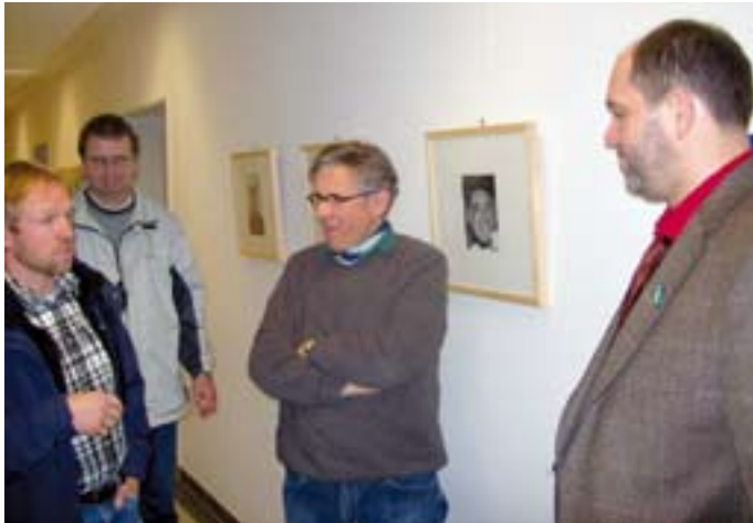
In der Beruflichen Rehabilitation und Therapie.

eine WfbM, gewährleistet ist. Er verweist hier deutlich auf die Chancenvielfalt und Eigenverantwortung im Sinne von Empowerment. Auch bezüglich des Werkstattlohnes sollten die Werkstattträte weiter am Ball bleiben!