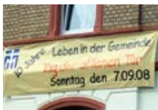
Das Motto: Leben in der Gemeinde.

Heute werden in einem multiprofessionellen Team 43 Klientinnen und Klienten aus dem Versorgungsbereich der Stadt Hermeskeil und den Verbandsgemeinden Hermeskeil und Thalfang sowie aus Teilen der Verbandsgemeinden Kell am See und Ruwer begleitet und individuell betreut.