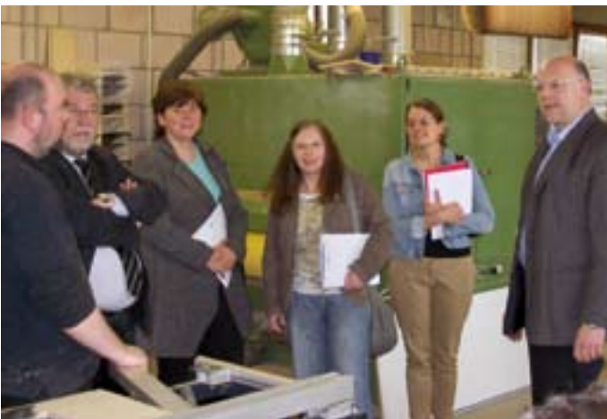
In der St. Bernhards-Werkstatt (WfbM)