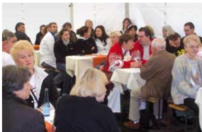
Großer Andrang beim Tag der offenen Tür.