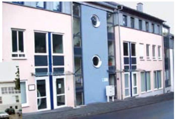
Mit einer Informationsveranstaltung präsentierte sich das Gemeindepyschiatrische Betreuungszentrum, Tiergartenstr. 84, in 54595 Prüm.