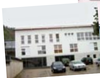
Der Erweiterungsbau des GPBZ Prüm.

Die Konzeption „Empowerment & Coaching auf dem Schönfelderhof“ kann unter www.bb-schoenfelderhof.de eingesehen werden.