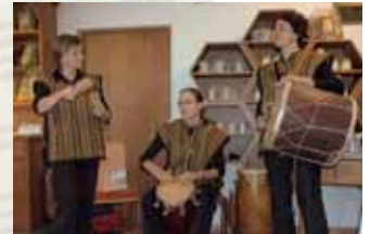
„Akom Familie“ – Trommelklänge aus Westafrika.

rioni erläuterten den Beitrag des Schönfelderhofes als Arbeitgeber und Wohnbetreuung für Menschen mit einer psychischen Beeinträchtigung sowie als Verarbeiter regional produzierter Rohstoffe (z.B. Mehl für den Natursauerteig).