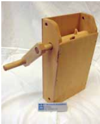
Oster-Klapper vom Schönfelderhof.

Klappermädchen und -jungen übernehmen in der Region zwischen Gründonnerstag und Karsamstag die Funktion der Kirchenglocken.