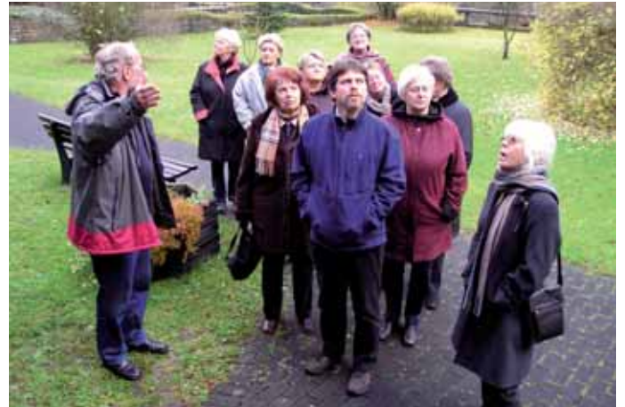
Laienhelferausflug 2007: Besichtigung der Senfmühle und der Villa Sarabodis.

Genau diese Erfahrungen gelten, so meine Erfahrungen und meine Überzeugung, für die Besuche unserer Laienhelfer bei den Bewohnern des Schönfelderhofes und in den Außenwohngruppen der Fidei. Hier schenken Menschen Zeit, lernen voneinander, hören einander zu und geben dadurch einander Wert. Hier unternehmen Menschen etwas miteinander, sei es ein Spaziergang, ein gemeinsamer Einkauf oder auch die gemeinsame Tasse Tee oder Kaffee. Für diese wichtige, segensreiche Aufgabe wollen wir neue Menschen gewinnen und diese durch eine fundierte, kompetente und erfahrungsbezogene Begleitung an diese Form der Nächstenliebe heranzuführen.