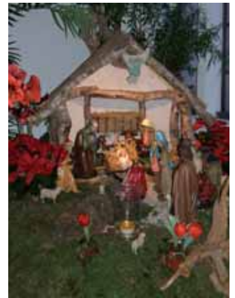
Krippe aus der Kapelle des Schönfelderhofes.