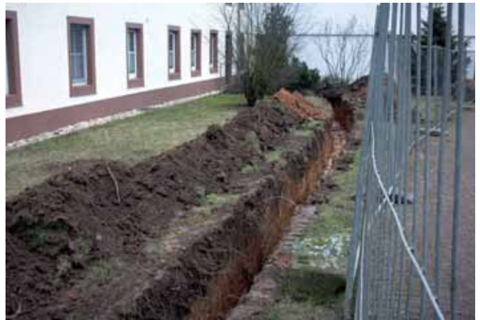
Verlegung der Wärmeleitungen zur Heizzentrale.