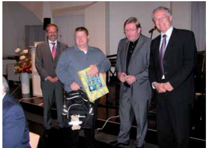
So sieht ein stolzer Preisträger aus.

Beim Monat Februar wurde mein Name aufgerufen und ich ging nach vorne. Mir wurde gratuliert und ich mußte viele Hände schütteln. Alle Gewinner bekamen außer einem Geschenk im Wert von 30,-€ einen hochmodernen Rucksack geschenkt. Bei der Geschenkübergabe wurden wir fotografiert und gefilmt, dazu gab es viel Applaus.