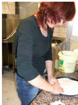
Die Pizza nimmt Gestalt an.

Eine weitere Unsicherheit betraf auch meine beiden Chefs und Kollegen. Wie gehen sie mit mir um, und wie reagieren sie, wenn ich Fehler mache?