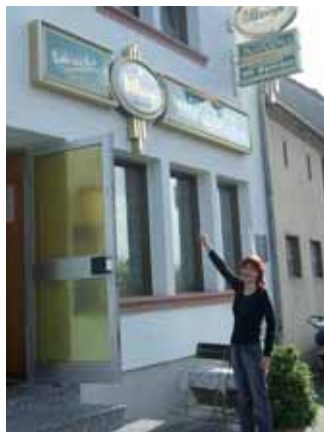
Hier arbeite ich.

Eine gewisse Unsicherheit vor diesem großen Schritt blieb dennoch bestehen. Ich wusste aber, dass ich während des Praktikums und darüber hinaus von der WfbM weiter betreut werden würde.