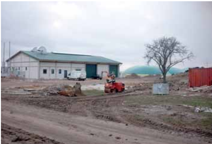
Blick auf die Biogasanlage in Richtung Orenhofen.