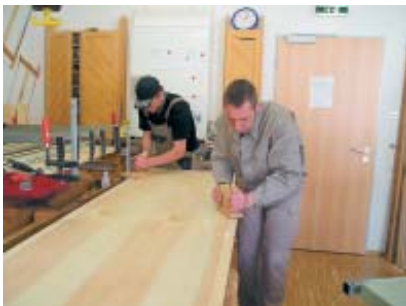
Letzte Feinarbeiten mit dem Handhobel.

Für den erfolgreichen Verlauf von Eingangsverfahren und Berufsbildungsmaßnahme stehen die Mitarbeiter des Berufsbildungsbereichs stets in engem Kontakt mit dem Sozialdienst, den Arbeitsbereichen, der Werkstattleitung sowie den Kollegen der