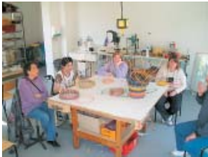
Korbflechten mit Peddigrohr.

Der Schönfelderhof bietet Menschen, die aufgrund der Art oder Schwere ihrer Behinderung oder ihres Alters nicht mehr in der Lage sind, am Arbeitsprozess teilzunehmen, eine interne Maßnahme zur Tagesstrukturierung an. Ziel ist der Erhalt und die Förderung der geistigen, seelischen und körperlichen Mobilität.