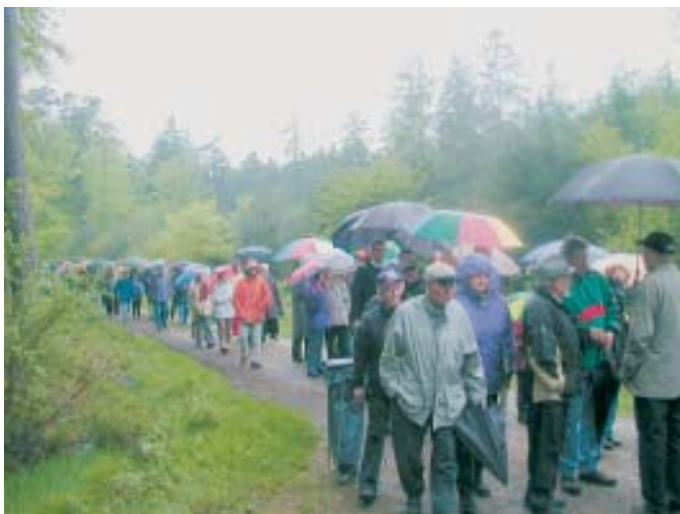
Wie ein großer Lindwurm zieht sich die Wandergruppe durch den Wald.

Während des Weges vom Parkplatz, am neuen Dienstleistungs- und Betreuungszentrum vorbei, die Gärtnerei und den Weiher links liegend lassend zum Peter Friedhofen-Kreuz hörte man immer wieder den Satz: „Es gibt für Wanderer nie schlechtes Wetter, es gibt nur die falsche Kleidung!“