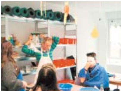
Werkraum: Vorarbeiten zur Herstellung von Gesichtsmasken.

„Die psychiatrische Tagesstätte in Bitburg ist eines der Angebote des Gemeindepsychiatrischen Betreuungszentrums (GPBZ). Das Hilfs- und Betreuungsangebot der Tagesstätte richtet sich an Menschen, die aufgrund oder infolge einer psychischen Erkrankung nicht in der Lage sind, einer Beschäftigung auf dem regulären Arbeitsmarkt nachzugehen oder eine feste Tagesstruktur im Alltag aufrechtzuerhalten. Diese Einrichtung wird von psychisch kranken Menschen aus der Stadt Bitburg sowie deren regionaler Umgebung tagsüber besucht. Psychisch kranke Menschen haben hier unter der Woche jeden Tag die Möglichkeit, mit anderen Kontakt zu haben. Das Hilfs- und Betreuungsangebot ist recht umfangreich und umfasst mehrere Schwerpunkte wie Ergotherapie oder Haushaltstraining. Ebenfalls wichtige Punkte im Betreuungsprogramm sind das Üben von Tages- und Wochenplanung, die Förderung kognitiver Fähigkeiten sowie die Verbesserung des Kommunikations- und Sozialverhaltens. Abgerundet wird das Betreuungsangebot der Tagesstätte durch gemeinsame Freizeitaktivitäten und Urlaubsmaßnahmen.“