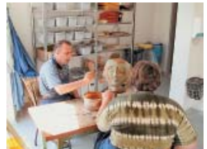
Figürliches Arbeiten mit Ton.