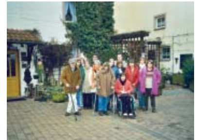
Neuerburg war für alle eine Reise wert.

Alles in allem war es eine gelungene und schöne Ferienfreizeit, die geprägt war von Ruhe und Entspannung, aber auch von vielseitigen Aktivitäten.