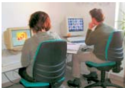
Kognitives Training am PC.

nen die Angebote der WfbM kennen und sind maßgeblich an der Entscheidung beteiligt, ob sich eine berufliche Bildungsmaßnahme anschließt.