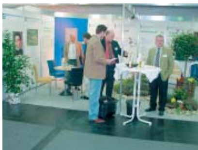
Informationsstand der St. Bernhards-Werkstätten.

Die bundesweit größte Leistungsschau der Werkstätten für behinderte Menschen (WfbM), die Werkstätten Messe Offenbach, fand dieses Jahr letztmalig in Offenbach statt.