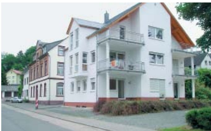
Psychisch kranke Menschen können im GPBZ Hermeskeil wohnortnah und nach einem individuellen Hilfeplan betreut werden.

Hermeskeil. 31 psychisch kranke Menschen werden im Gemeindepsychiatrischen Zentrum (GPBZ) in Hermeskeil betreut. Sie erhalten dort so viel Hilfe wie notwendig und so wenig Hilfe wie möglich, auf dem Weg zu einer großen Lebenszufriedenheit und Selbstständigkeit.