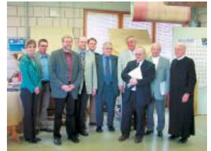
Besuch der St. Bernhards-Werkstätten.