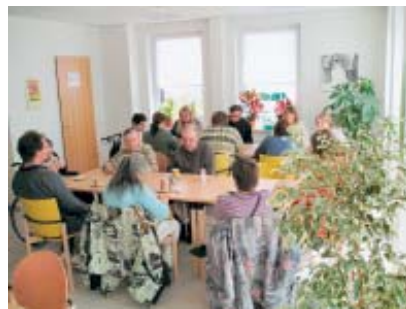
Kaffeerunde im offenen Treff.

Der eigentliche Sinn ist – wie der Name schon sagt – darin zu sehen, dass der offene Treff als Begegnungsstätte für alle, die wollen – auch Besuchern von außerhalb, also vor allem von den umliegenden Gemeinden –, offen steht.