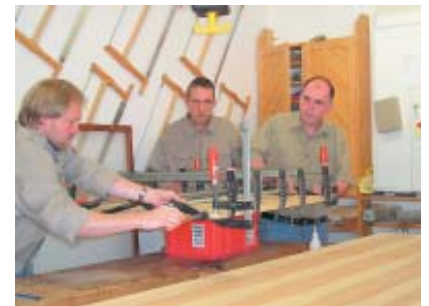
Einspannen eines Werkstückes.