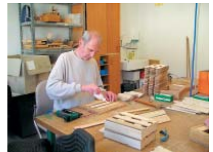
Serielle Tätigkeiten: Ziegenkäsekästchen.