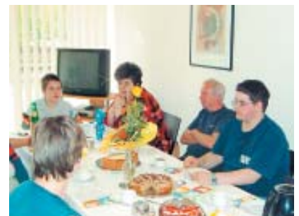
Geburtstagsfeste und gemeinsame Kaffeerunden in der Tagesstätte.