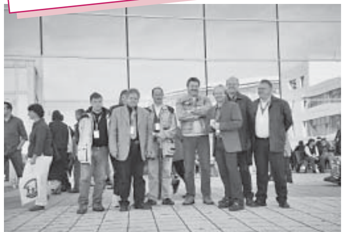
Die „Delegation“ der St. Bernhards-Werkstätten vor der Messe Erfurt.

Parallel dazu trafen sich die Werkstatträte, Vertrauenspersonen und andere Interessierte bei der Vierten Zukunftskonferenz der Werkstatträte unter dem Motto: „Wie wir in Zukunft leben und arbeiten wollen. Meine Forderungen an Arbeit, Bildung und Mitwirkung in meiner Werkstatt.“