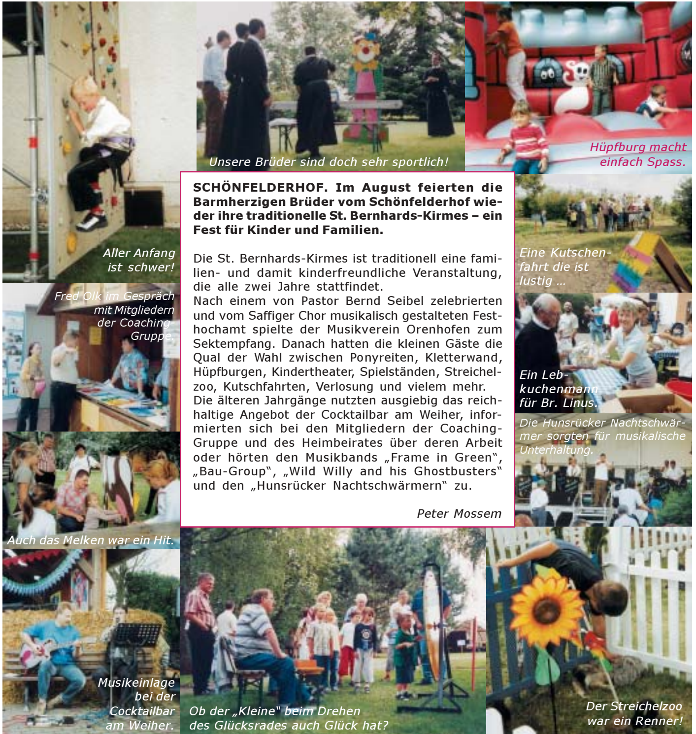
Unsere Brüder sind doch sehr sportlich!