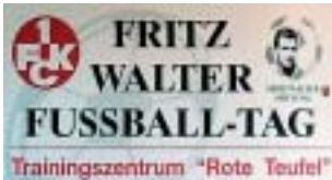
Fritz Walter Fussball-Tag