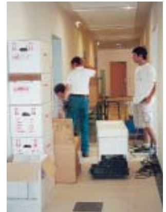
Wohin mit den Kisten?

Die ersten Planungen für den Umzug der Beruflichen Bildung in das Dienstleistungs- und Betreuungszentrum begannen frühzeitig. Wegen der zahlreichen Maschinen aus Metall- und Holzwerkstatt und der neuen Absauganlage für die Schreinerei, sollten wir die Ersten im Neubau sein. Allerdings zog sich das Vorhaben dann über den ganzen Sommer hin, weil einige Arbeiten am Gebäude noch nicht fertiggestellt waren.