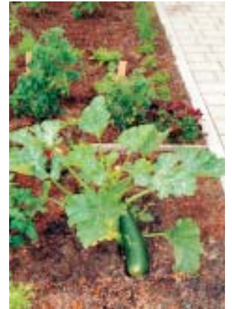
Garten auf dem begrün- ten Dach der Tiefgarage.

BITBURG. Dies ist zumindest die Meinung aller Bewohner, Besucher und Betreuer des Gemeindepsychiatrischen Betreuungszentrums (GPBZ) Bitburg.