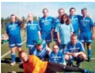
Der Deutsche Meister aus Rheinland-Pfalz

Beim Fußball-Endrundenturnier der Rheinland-Pfalz/Saarland-Meisterschaften, das am 7. September 2004 in Kaiserslautern stattfand, belegte die deutlich ersatzgeschwächte Mannschaft aus Zemmer einen guten vierten Platz. Auf dem Gelände des Leistungszentrums Fröhnerhof spielten im Sportpark „Rote Teufel“ die Mannschaften aus Engers, Kastellaun, Koblenz, Ludwigshafen, Neunkirchen, Püttlingen, Trier und Zemmer auf dem Kleinfeld (d.h. mit je sieben Spielern) gegeneinander. Veranstaltet wurde das Turnier in Kooperation mit der LAG WfbM Rheinland-Pfalz, dem 1. FC Kaiserslautern, dem Südwestdeutschen Fußballverband und dem Behindertensportverband Rheinland-Pfalz.