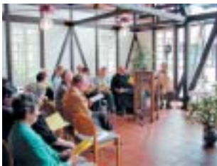
Die Liturgie-Gruppe des Schönfelderhofes bei den Fürbitten.

Am 23. Juni 2004, dem 20. Jahrestag seiner Seligsprechung, wurde auf dem Schönfelderhof das Fest zu Ehren des Peter Friedhofen gefeiert.