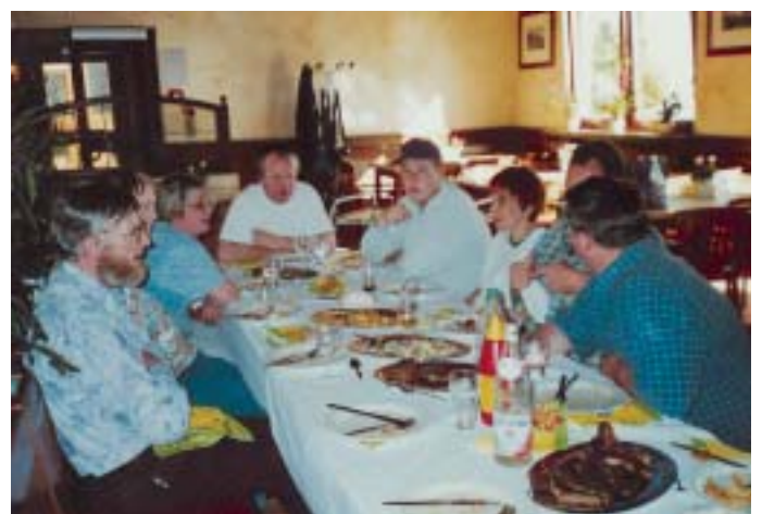
Zehn Jahre Bäckerei: Nach dem Vier-Gänge-Menü waren alle geschafft.