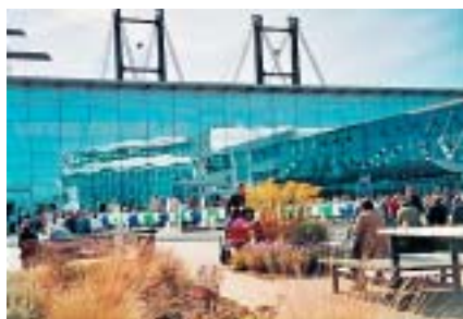
Ein imposantes Tagungsgebäude: Die Messe Erfurt.

Vom 15.-17. September 2004 fand der 10. Werkstätten-Tag in Erfurt statt. Rund 1.600 Teilnehmerinnen und Teilnehmer tauschten sich zum Thema „Unsere Werkstätten. Arbeit. Bildung. Förderung: Zukunft für alle“ in zahlreichen Arbeitsgruppen aus.