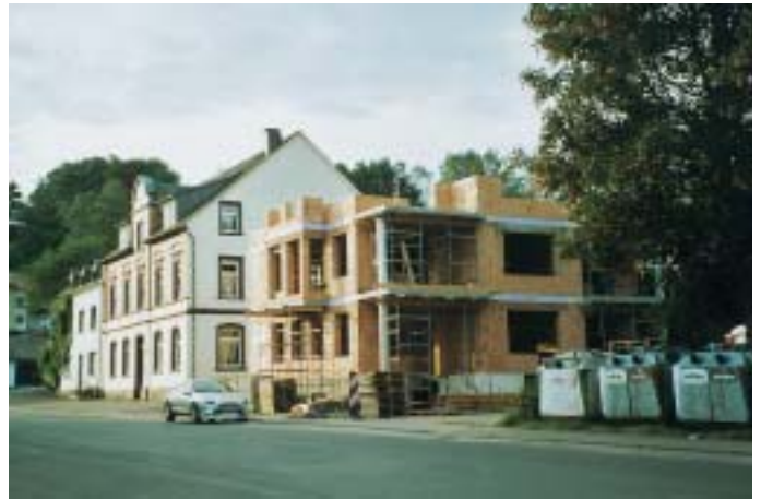
Erweiterung des GPBZ Hermeskeil.

Ein weiterer Teil des Konzepts besteht darin, dem wachsenden Bedarf nach intensiv betreuten Einzelwohneinheiten nachzukommen. Hier erstellte der kooperierende Bauträger unmittelbar neben das GPBZ ein Wohngebäude, in dem drei Einzelappartements für diesen Bedarf zur Verfügung stehen. Diese innerhalb