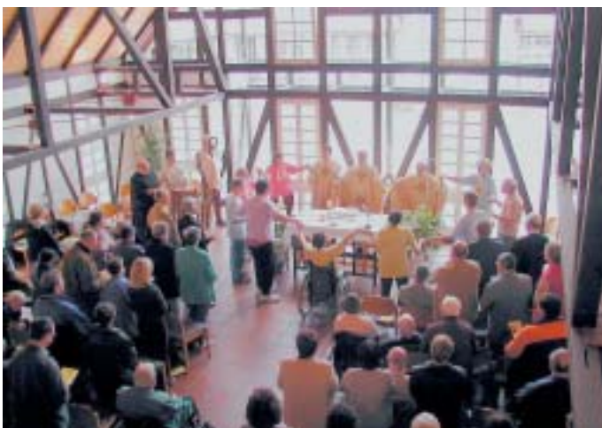
Weihbischof Schwarz beim Gottesdienst.